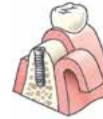
Het implantaat wordt aangebracht