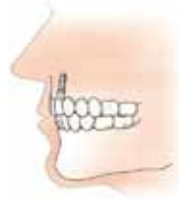
Een tand is vervangen door een implantaat en een kroon

De tandarts plaatst op het implantaat een kroon van metaal of keramiek.