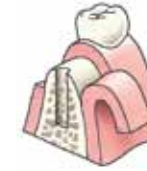
Er wordt een gaatje in het bot geboord