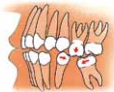
Zij aanzicht van een kaak: uitgroeien en scheef gaan staan van kiezen

Als tanden en kiezen ontbreken, kunnen de tanden of kiezen van de andere kaak in de richting van de open ruimte groeien. Ook kunnen de tanden of kiezen aan weerszijden van de open ruimte naar elkaar toe groeien, waardoor ze scheef gaan staan.