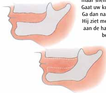
Het slinken van uw kaken gaat heel ongemerkt

Gaat uw kunstgebit loszitten? Ga dan naar uw behandelaar. Hij ziet meestal direct wat er aan de hand is en kan u het beste advies geven.