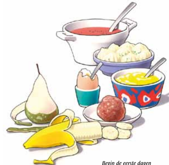
Begin de eerste dagen met zacht voedsel

Eten met uw nieuwe kunstgebit is wat onwennig. Zeker in het begin zult u voorzichtig aan doen. U ervaart zelf het beste wat wel en niet kan. Neem de eerste dagen zacht voedsel, zoals puree, gehakt en zacht fruit. Probeer enkele dagen daarna een stukje vis en een aardappel. Weer later kunt u voedsel eten zoals vlees of een appel. Stukken afbijten kunt u met een kunstgebit beter niet doen. Snijd uw voedsel daarom in stukjes en kauw rustig en gelijkmatig met uw nieuwe kunstkiezen. Neem daarbij aan beide zijden een stukje voedsel in de mond. Neem er iets meer tijd voor dan dat u gewend was.