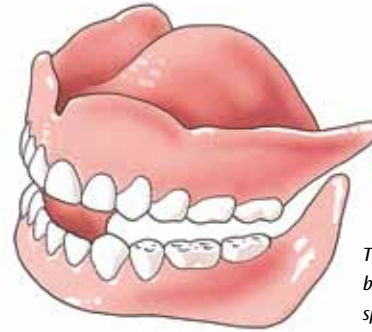
Tanden en kiezen zijn belangrijk voor het kauwen, spreken en het uiterlijk

Als u in de spiegel kijkt, moet u waarschijnlijk erg wennen. Uw mond is nu een maal een belangrijke blikvanger en die is veranderd. Neem een paar dagen de tijd om te wennen en beoordeel pas dan hoe u er met uw nieuwe tanden en kiezen uitziet.