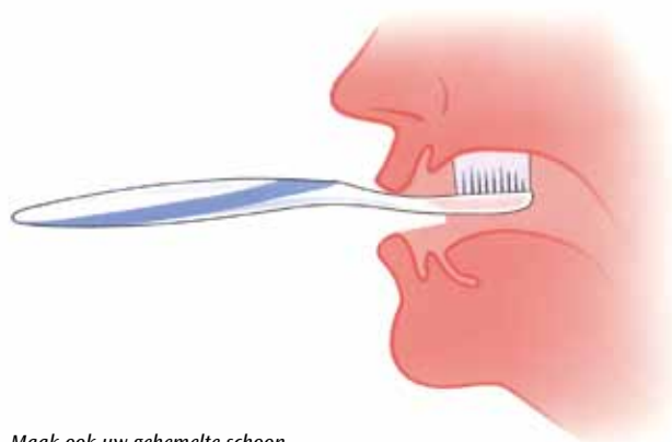
Maak ook uw gehemelte schoon

Houd behalve uw kunstgebit ook uw mond schoon. Spoel in het begin, als de wonden nog niet helemaal zijn genezen uw mond na elke maaltijd met een beetje lauwwater. Daarna kunt u uw tandvles beter met een zachte tandenborstel poetsen. Gebruik daarvoor gewone fluoridetandpasta. Masseer met een zachte tandenborstel minstens één keer per dag het slijmvlies waarop uw kunstgebit rust: uw kaken en de overgang van de kaak naar de wangen. Poets ook uw gehemelte, want ook daar kunnen voedselresten zitten.