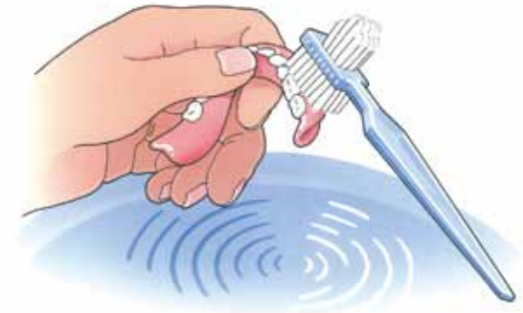
Reinig uw kunstgebit na iedere maaltijd

Uw kunstgebit is nu nog nieuw en mooi. Dat wilt u natuurlijk graag zo houden. Daarom moet u, net als bij eigen tanden en kiezen, uw kunstgebit verzorgen. Als u het niet regelmatig schoonmaakt, blijven er voedselresten achter. Zowel op uw kunstgebit als eronder. Als u die niet verwijdert, kan uw tandvlees op den duur gaan ontsteken. Reinig uw gebit daarom zorgvuldig na iedere maaltijd. Gebruik een speciale protheseborstel, bijvoorbeeld van Lactona of Oral-B, en water om etensresten goed te verwijderen. Gebruik géén tandpasta. Die kan te veel schuren. Een schoon kunstgebit voelt altijd glad aan. Laat uw gladde gebit tijdens het reinigen niet uit uw handen lippen. Het zal kapot gaan. Vul voor de zekerheid eerst de wasbak met water en reinig uw gebit daarboven.