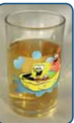
Ook appelsap is een zuur tussendoortje

Behalve goed poetsen, napoetsen en controle, is het belangrijk dat je goed op de voeding van je kind let. Op en tussen de tanden en kiezen ontstaat tandplak: een nauwelijks zichtbaar, plakkerig wit-gelig laagje. De bacteriën in de tandplak zetten suikers (bijvoorbeeld uit snoep, koek, frisdrank en fruit) en zetmeel (bijvoorbeeld uit aardappels, pasta, brood of crackers) in de mond om in zuren. Die zuren veroorzaken gaatjes (cariës) in het gebit. Frisdrank, vruchten(sap) en bijvoorbeeld sportdrank bevatten behalve suikers ook zuren. Zuren kunnen het tandglazuur oplossen. Deze vorm van slijtage heet tanderosie. Beperk om gaatjes en tanderosie te voorkomen het aantal eet- en drinkmomenten tot maximaal zeven per dag: drie keer een maaltijd en maximaal vier keer per dag een tussendoortje.