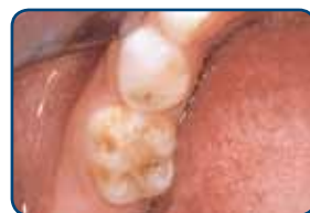
Een kaaskies in een melkgebit

Kaaskiezen zijn kiezen met plekken waarvan het glazuur minder hard is. Deze plekken zijn herkenbaar aan de geelbruine verkleuringen. Meestal treden ze op bij de eerste grote kiezen (zie foto's). De afwijking kan zich beperken tot enkele plekkjes, maar ook kan een heel vlak worden aangetast. In kaaskiezen ontstaan vaak gaatjes. Ook kunnen ze snel afbrokkelen door slijtage. Ze zijn vaak gevoelig voor koud en warm en ook zoetigheid doet vaak zeer. Kinderen met kaaskiezen vermijden daarom wel vaker zoetigheden. Denk je dat je kind last heeft van kaaskiezen? Neem dan contact op met je tandarts.