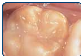
Een kaaskies in een blijvend gebit