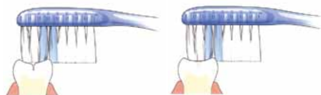
Tandenborstel komt niet in de groef

Zowel melkkiezen als blijvende kiezen hebben veel groefjes op het kauwvlak. Daarin ontstaat gemakkelijk tandplak. Niet regelmatig verwijderde tandplak kan gaatjes veroorzaken. Goed poetsen dus! Om het kauwvlak goed te beschermen, kan de tandarts een laagje 'kunsthars' (sealant) aanbrengen. Dit heet 'sealen'. Diepe groeven kan hij door het sealen afdichten. Alleen de blijvende kiezen komen hier normaal gesproken voor in aanmerking, meestal kort nadat ze helemaal zijn doorgebroken. De tandarts zal alleen sealen als hij verwacht dat er gaatjes in de groefjes ontstaan. Ook gesealde kiezen moet je goed poetsen.